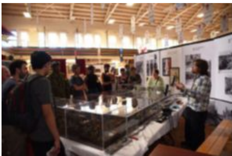
Salle d'exercice, bannières et maquettes, Journée des Musées montréalais

On y parle de l'exposition d'été qui incorporait des artefacts de notre collection ainsi que la réactualisation des bannières aux Honneurs de Batailles, des nouveaux stores pour nos fenêtres et les panneaux explicatifs. On y raconte aussi notre participation à la Journée des Musées montréalais du 28 mai dernier (près de 1000 visiteurs) et les anecdotes entourant nos Tambours régimentaires. L'équipe du Musée a aussi participé aux décors fantastiques de la salle d'exercice lors du Gala régimentaire du 14 octobre et à la restauration/confection des uniformes d'époque tant de cérémonial que de combat pour habiller des fusiliers ce soir-là. Le Musée s'est aussi impliqué dans la Journée Portes Ouvertes de la Réserve le 4 novembre.