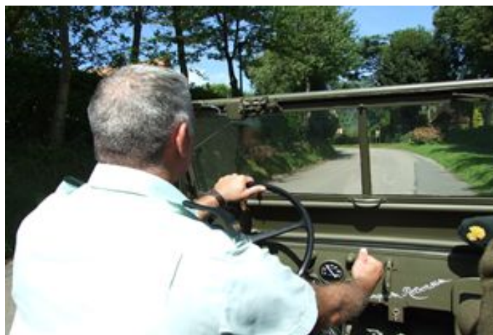
J'avais promis au SMR Côté de rester discret, ça ne sortira pas de la famille régimentaire. Voici le SMR testant la conduite d'une jeep ! Une vraie !!