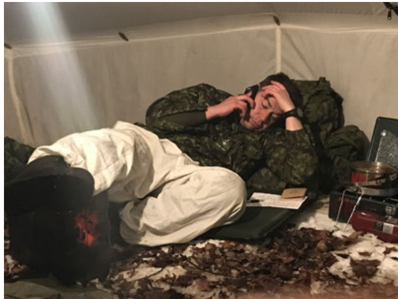
Le Capt Monette fait son rapport log (brief log) quotidien à partir d'une position horizontale qui est plus tactique.