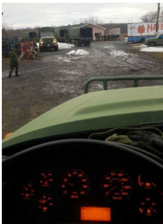
Vue du chauffeur de camion lors d'un ravitaillement à l'échelon A.

Suite aux procédures d'entrées le lundi, la cie B se déploya à St-Rémi où la première cache fut établie. Le lendemain, mardi, la cie effectua sa première manœuvre offensive en allant prendre et tenir l'obj PONY à Napierville .