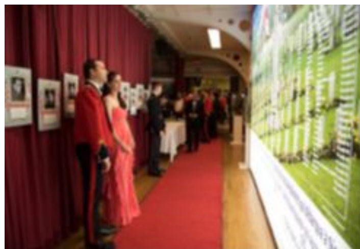
Gala régimentaire 14 oct. 17, grands panneaux hommage aux morts à Dieppe