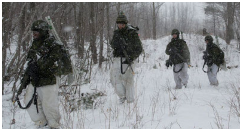
Les troupes avancent vers l'objectif.