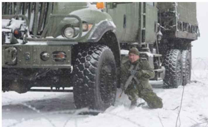
L'ennemi s'est infiltré.

Le mercredi, la cie B a effectué une attaque délibérée de cie sur une usine désaffecté au sud de Saint-Jean-sur-Richelieu , l'obj LION, supporté par du tir direct d'un canon de 105mm ainsi que d'une équipe AI (Activités d'Influence), puis le jeudi, trois attaques délibérées de peloton afin de détruire l'obj HAWK à l'aéroport de Bromont .