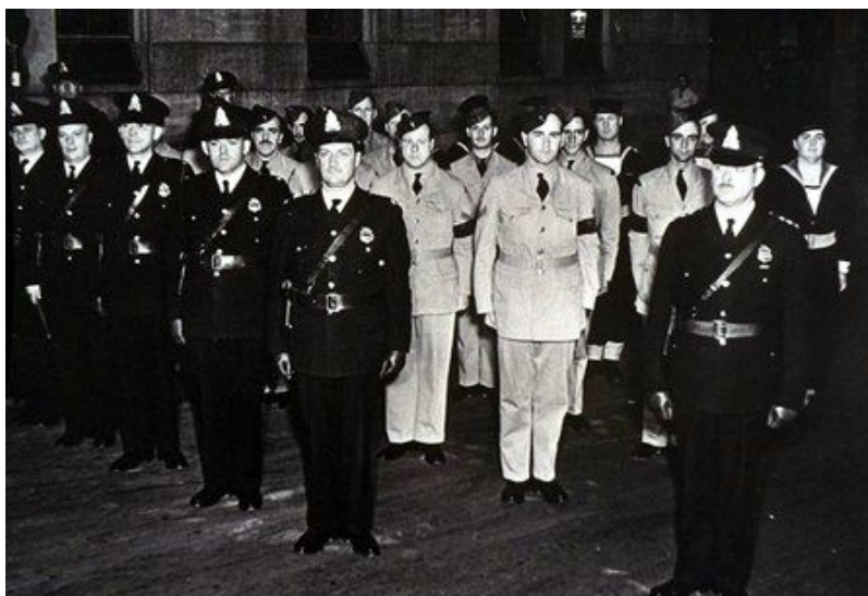
Patrouilles mixtes de policiers civils et militaires