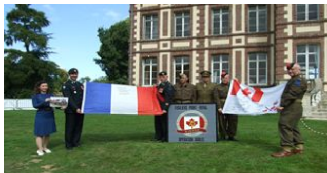
Échange des drapeaux

Le dernier jour, les ingérables organisent un repas, où sont invités le Cmdt du Régiment, sa famille et le SMR. Notre cuisinier leurs propose un sauté de veau à la Normande. Durant ce repas, une évocation surgit avec l'idée de créer une association.