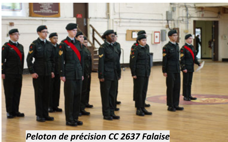
Peloton de précision CC 2637 Falaise