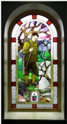
Vitrail sur la Porte du Souvenir du Champ d'honneur national du Fonds du Souvenir.

Texte et photos : Pierre Charette, Lcol (R)