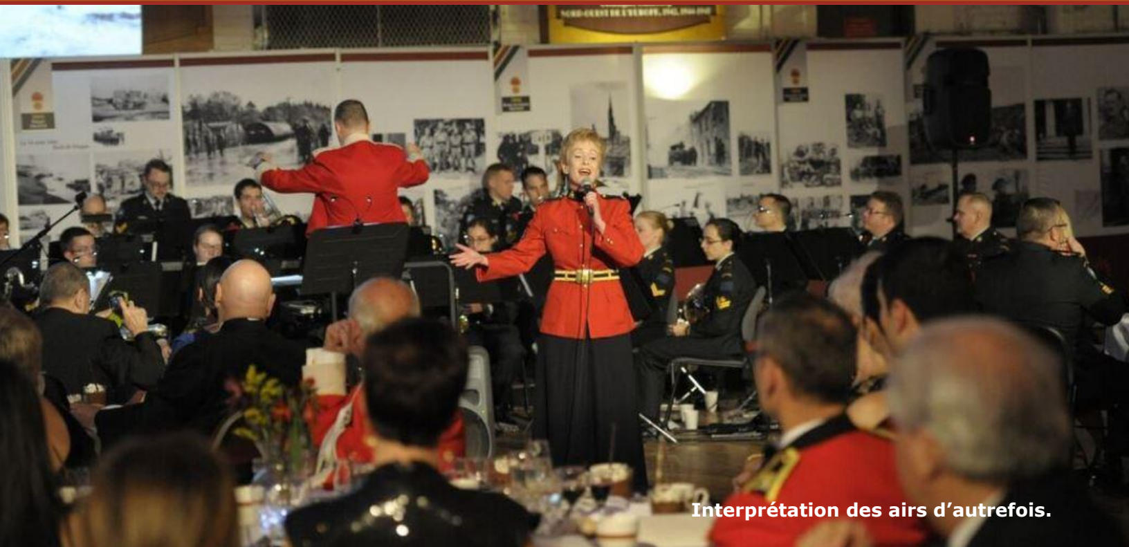
Interprétation des airs d'autrefois.