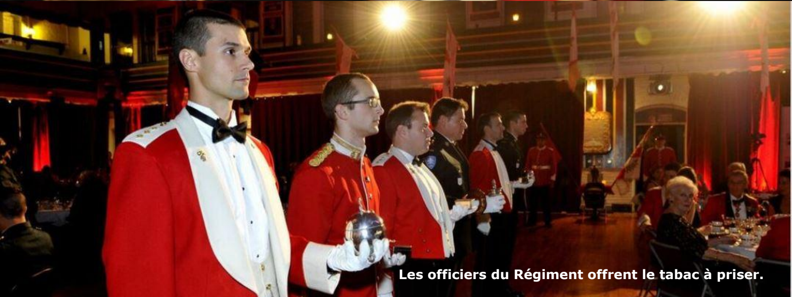
Les officiers du Régiment offrent le tabac à priser.