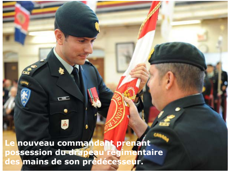
Le nouveau commandant prenant possession du drapeau régimentaire des mains de son prédécesseur.