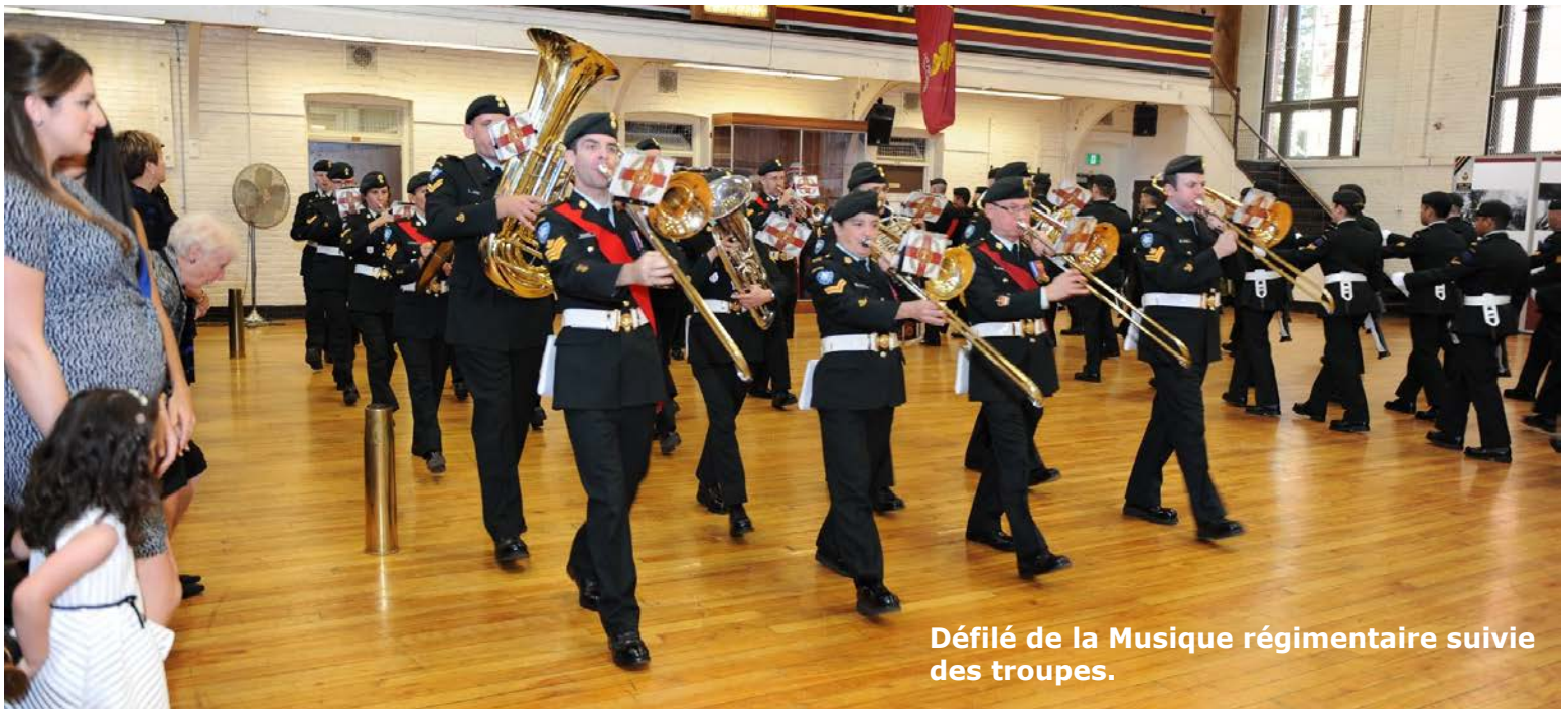
Défilé de la Musique régimentaire suivie des troupes.