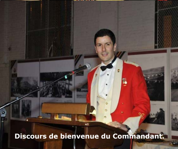
Discours de bienvenue du Commandant.