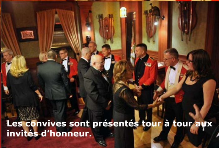
Les convives sont présentés tour à tour aux invités d'honneur.