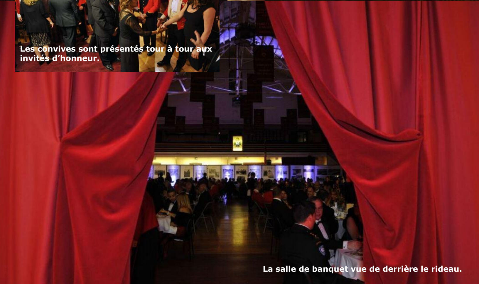
La salle de banquet vue de derrière le rideau.