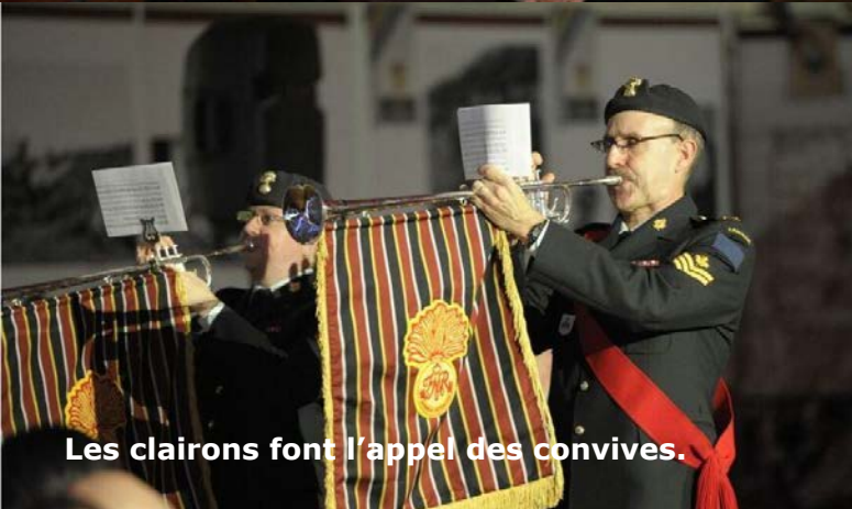
Les clairons font l'appel des convives.