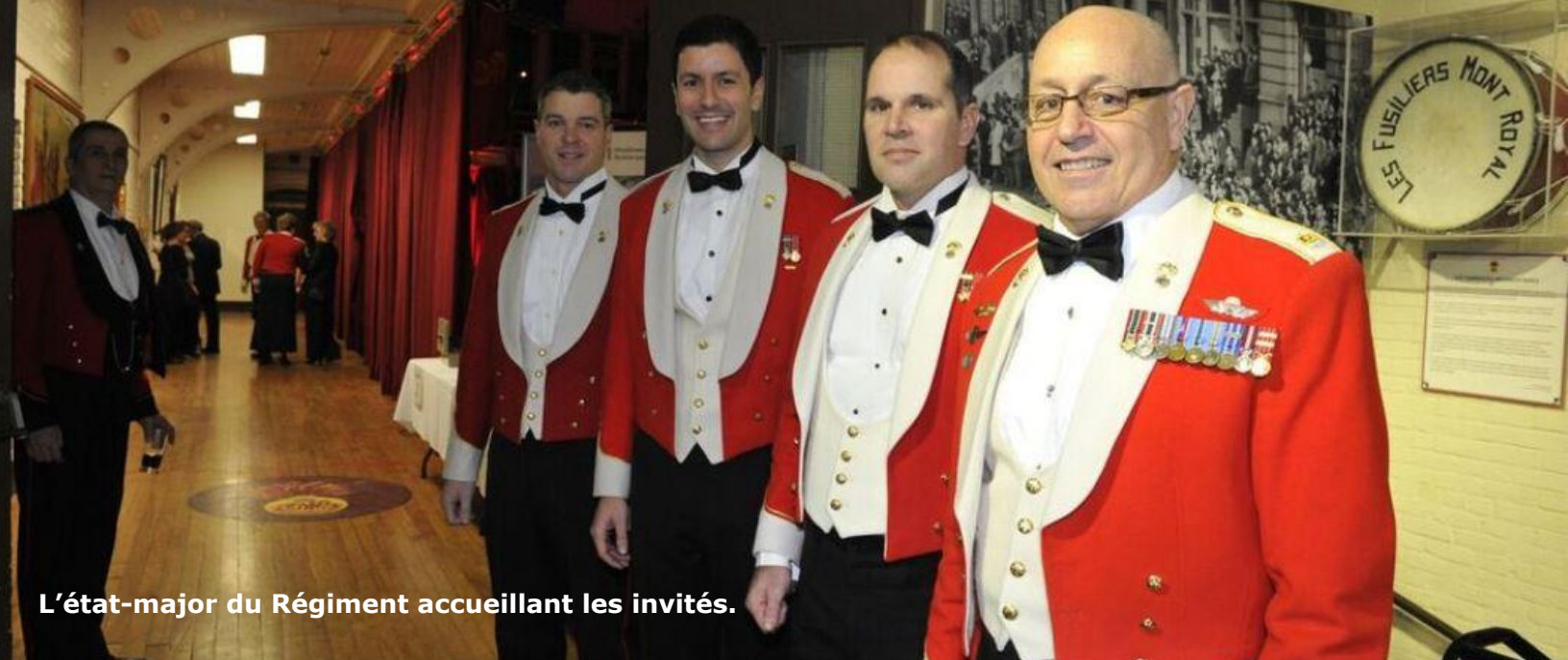
L'état-major du Régiment accueillant les invités.