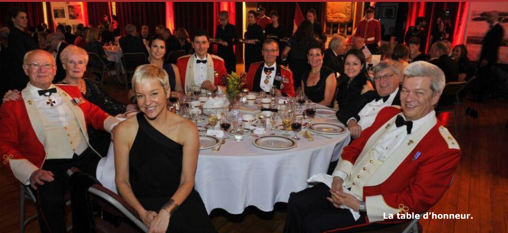
La table d'honneur.