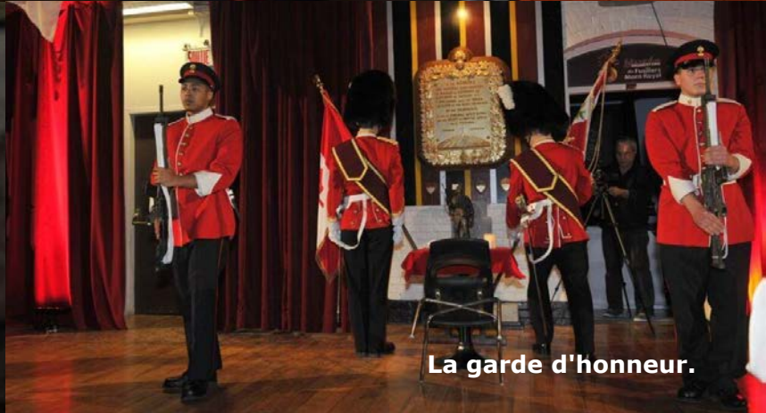
La garde d'honneur.